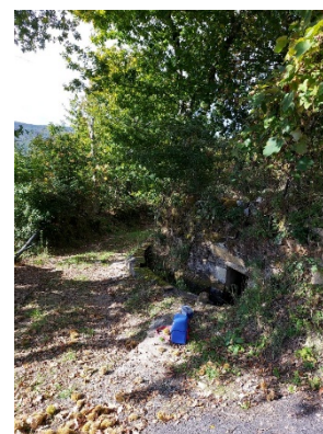
Trabalho de campo – Recolha de solo, desmonte e monitorização de vibrações