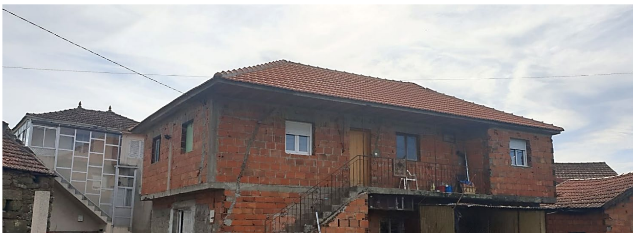
Reabilitação de Telhado em Casa de Covas do Barroso

Serão estas acções que iremos manter durante a nossa presença na região. Será sempre esta a marca que a Savannah irá deixar.